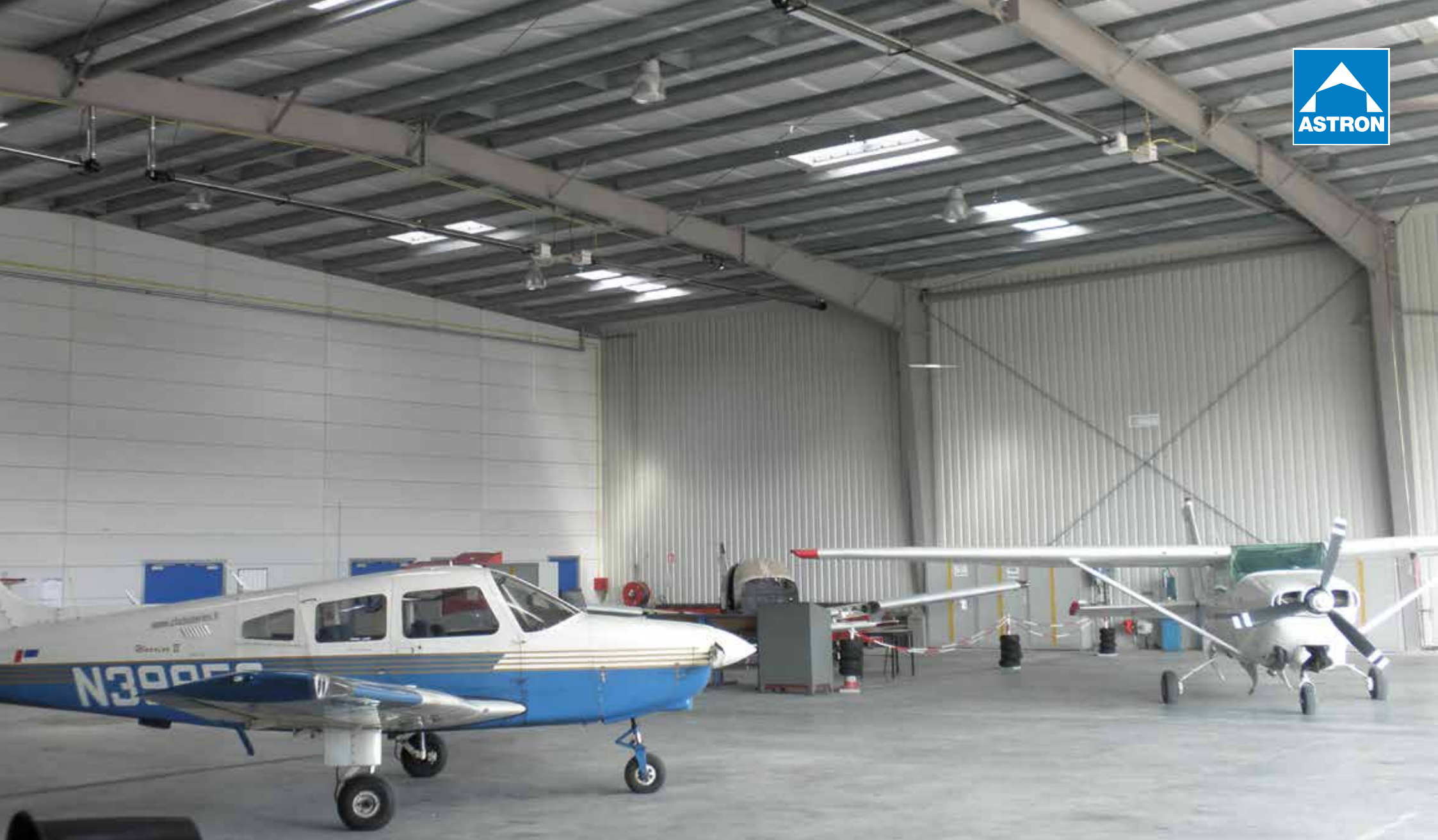
Hale stalowe Astron Hangary lotnicze